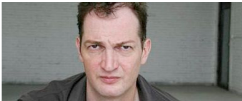
Martin Wehmer © Martin Wehmer

MW: Das ist für den Westen eine interessante Frage. Eine These zu dieser Frage liefert die Jackson Pollock Bar (Theatergruppe aus Freiburg, Anm. d. Red.), die wir auch gerne eingeladen hätten, die aber durch ihren Venedig-Auftritt nicht nach Peking kommen konnten. Diese Gruppe hat einen Text mit 99 Thesen zu ihrem Auftritt herausgegeben, der übrigens auch auf chinesisches in dem Katalog erscheinen wird. Dort wird von der Blindwerdung des Auratischen und der Blindwerdung des authentischen Künstlers gesprochen, natürlich eine Position, die im Westen schon sehr lange diskutiert wird. Ich würde jetzt nicht sagen, dass es den authentischen Künstler bei uns nicht gibt, aber uns ist es wichtiger, das Werk und die Möglichkeiten der Malerei aufzuzeigen und das was es über sich selbst hinweg aussagt. Die Person des Künstlers ist dem untergeordnet. Wir treten ja auch nicht missionarisch auf, wir liefern unseren Kommentar zur zeitgenössischen Malerei. Damit setzt unsere Schau sich deutlich von der muskelspielenden authentischen Kunst in China ab.